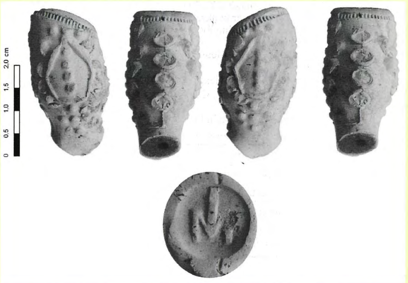
Een versierde pijpenkop uit Leeuwarden gemaakt door Jan Moselij. Zie pag. 5.

Het verhaal achter deze bijzondere pijp is te vinden op pagina 11.