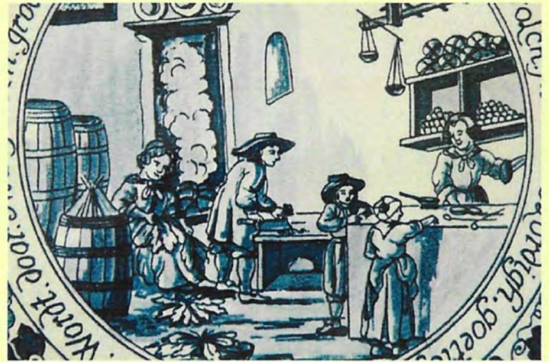
Detail van een wandbord waarop een tabakswinkel staat afgebeeld. Zie pagina 16.

Het verhaal achter deze bijzondere pijp is te vinden op pagina 11.