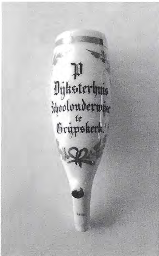
Afb. 1. 'P. Dijksterhuis schoolonderwijzer te Grijpskerk'.

Hoe gelukkig kan een verzamelaar zijn die 40 jaar voor de klas heeft gestaan en dan een onderwijspijp krijgt aangeboden. Het overkwam mij in november op de verzamelaarsjaarbeurs in Utrecht. Een mede-standhouder vroeg of ik interesse had in twee pijpen van dezelfde schoolmeester.